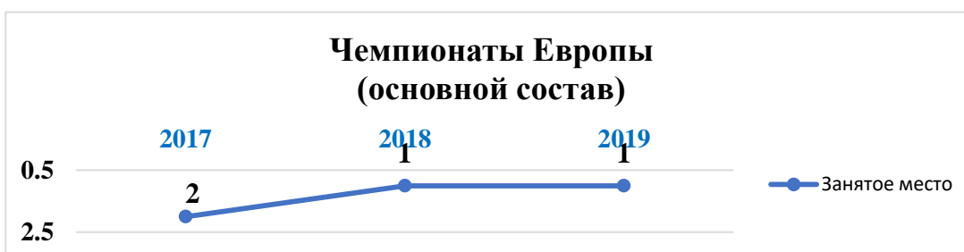
Диаграмма № 2 – Динамика выступлений основного состава на ЧЕ за период 2017-2019 гг.