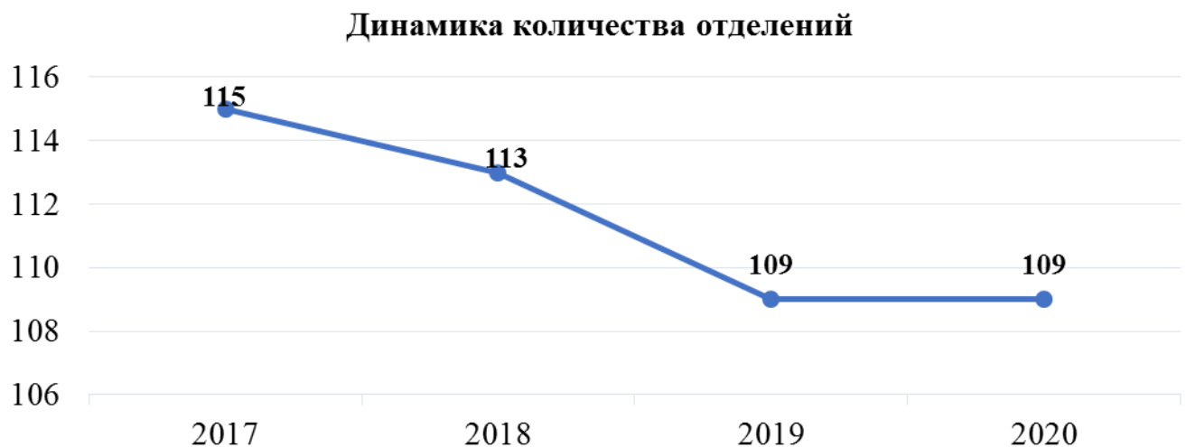
Диаграмма № 3 – Динамика количества отделений

В таблице № 25 отражены данные по субъектам Российской Федерации, в которых произошло закрытие и открытие отделений с 2017 по 2020 год