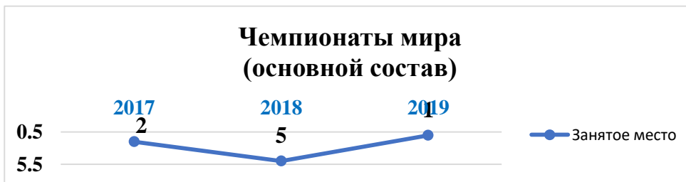
Диаграмма № 1 – Динамика выступлений основного состава на ЧМ за период 2017-2019 гг.