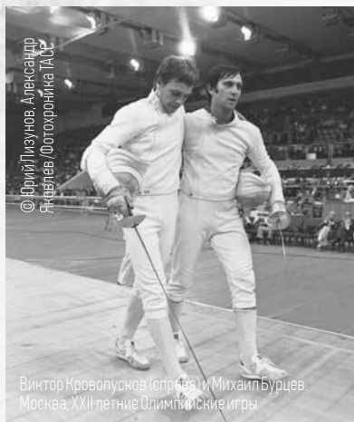
Виктор Кровопусков (справа) и Михаил Бурцев. Москва. XXII летние Олимпийские игры

этот гул победный клич самого Романькова, который, вскинув руки, подпрыгнул, сделал в воздухе несколько оборотов, изобразил еще какие-то невообразимые па.