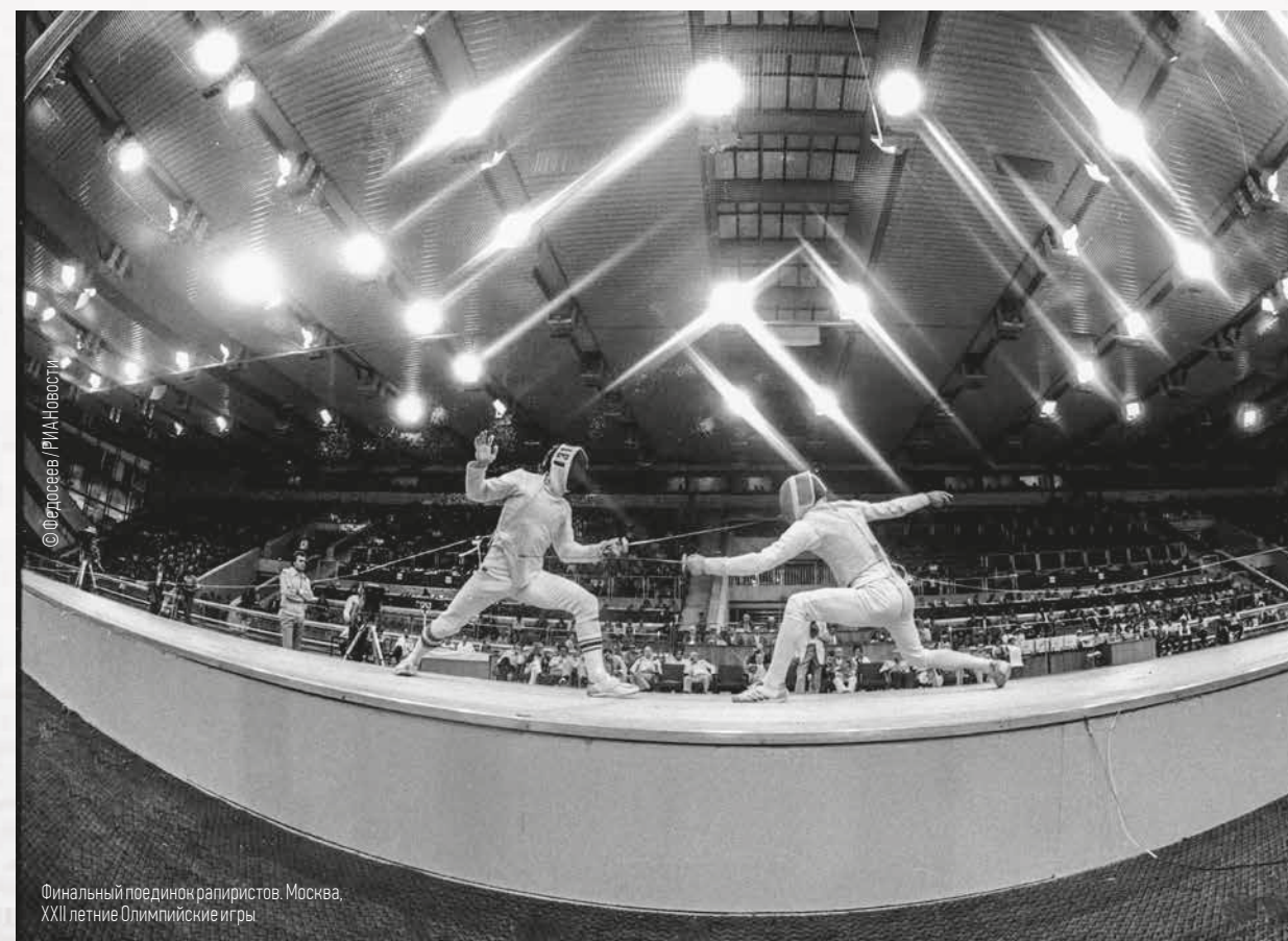
Финальный поединок рапиристов. Москва. XXII летние Олимпийские игры

Я недаром проделала экскурс в олимпийский год, потому что именно на Играх все признаки спортивной жизни обнажаются, выпячиваются, становятся наиболее зримыми и ощутимыми. Для любого спортсмена, попавшего на Олимпиаду, это событие становится главным в жизни. Ибо там он по-настоящему понимает грандиозность дела, которым занимается. На Олимпиадах молодежь всего мира демонстрирует, на что способен человек. Но высочайшие спортивные достижения – это всегда труд, упорство, борьба. А спорт в конечном итоге – это модель жизни, только в ней все события не растянуты во времени, а сконцентрированы в несколько лет или даже дней. ■