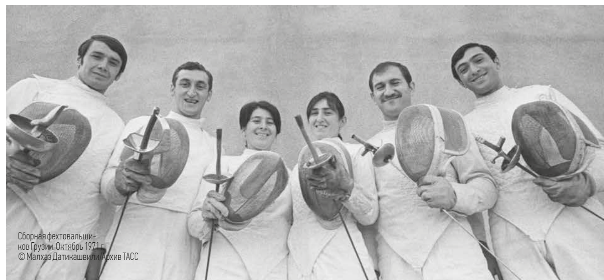
Сборная фехтовальщи- нов Грузии. Октябрь 1971 г.