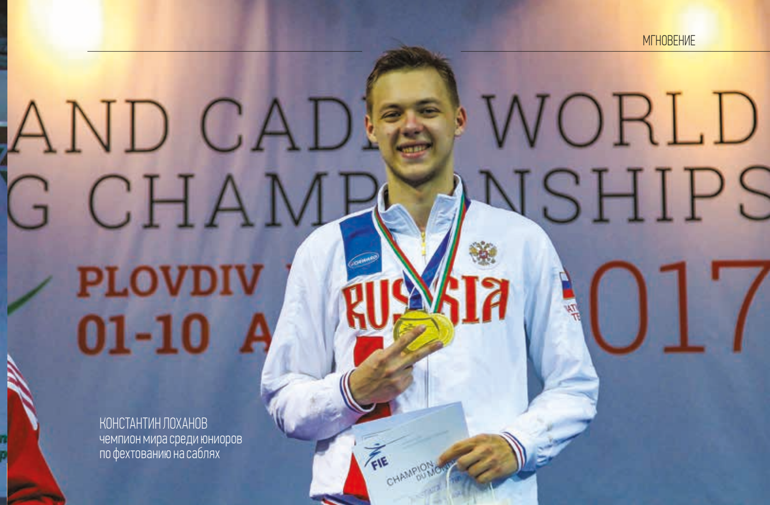
КОНСТАНТИН ЛОХАНОВ чемпион мира среди юниоров по фехтованию на саблях