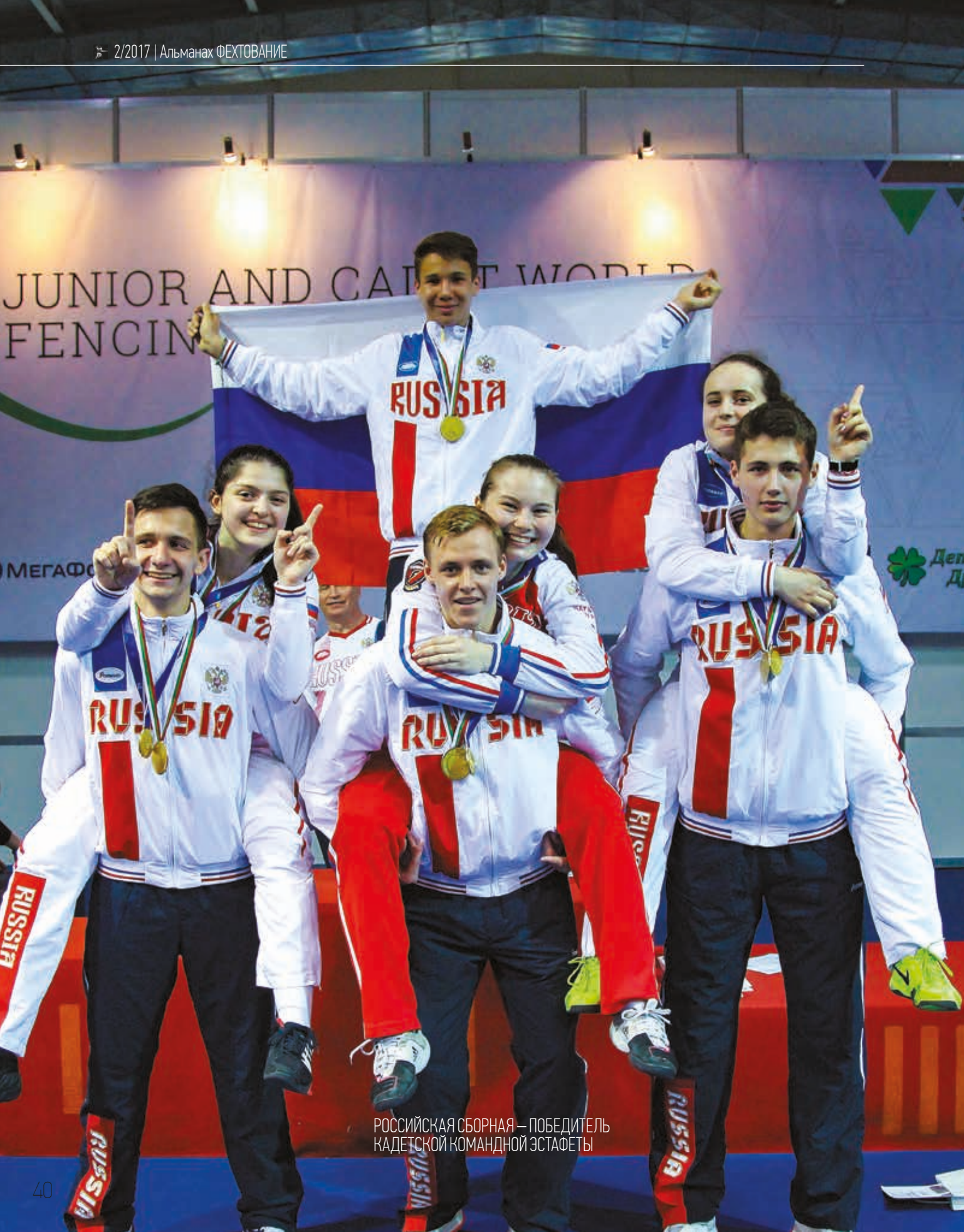
РОССИЙСКАЯ СБОРНАЯ — ПОБЕДИТЕЛЬ КАДЕТСКОЙ КОМАНДНОЙ ЭСТАФЕТЫ